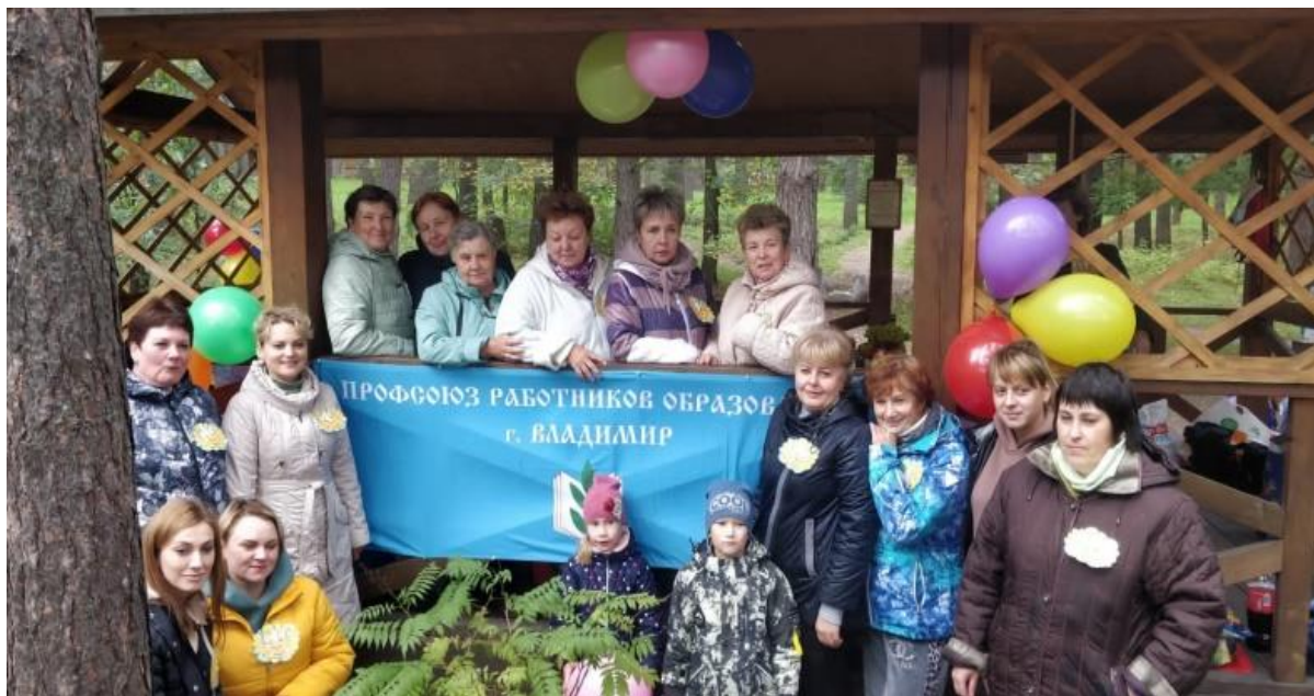
Отдыхай с профсоюзом, будешь здоров!

Быстро пролетело лето! Природа побаловала нас хорошей погодой, а профсоюз образования радуется своим членам профсоюза возможностью коллективного отдыха и снятия стресса в начале учебного года.